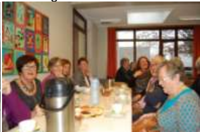
Ontvangst met Koffie+Koek