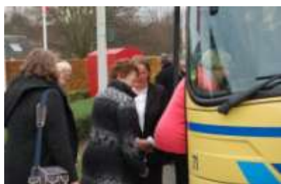
De bus weer in